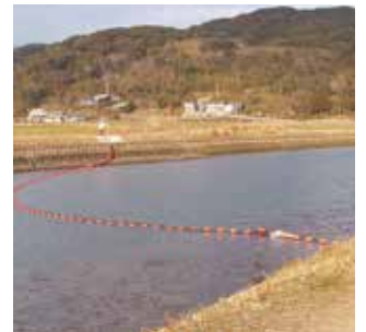
小規模河川の塵芥止めとして