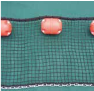
M60型L=20mで重量が45kg。人力で運搬・設置・撤収が可能です。