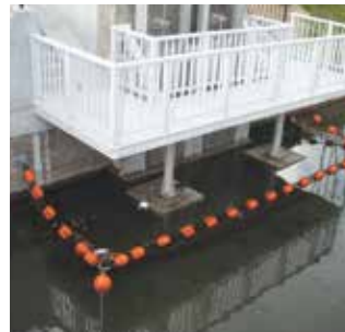
取水口の防塵設備として