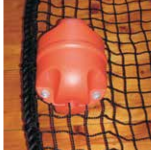
外被ポリエチレン製 φ150×L200