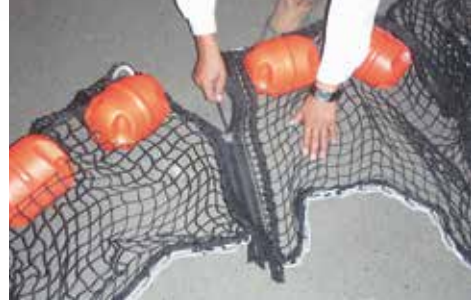
その他オプションで、曳航ロープ・集塵かご等をご用意しております。