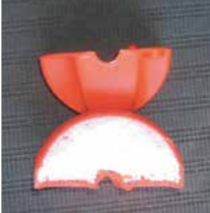
内部発泡スチロール充填