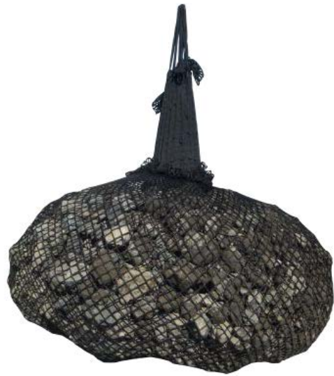
ロックユニットの外観